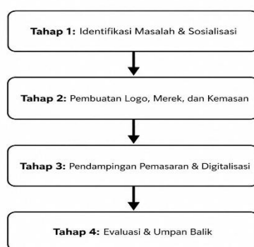
Gambar 1. Alur Tahapan Pelaksanaan Kegiatan Pemberdayaan UMKM Ayam Petelur Pak Muhib

Alur pelaksanaan kegiatan pemberdayaan dirancang secara sistematis melalui empat tahapan utama guna memastikan keterlibatan aktif pelaku usaha dari awal hingga akhir kegiatan. Tahapan-tahapan tersebut disajikan pada bagan berikut: