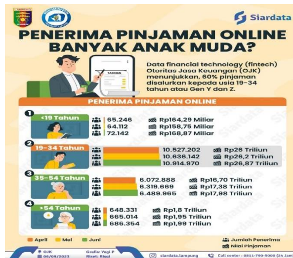
Gambar 1. Data Fintech OJK Pada Generasi Muda Tahun 2023

Fenomena ini tidak terlepas dari kondisi keuangan di Indonesia yang masih belum merata. Ketidakuasan terhadap kondisi ekonomi sering kali muncul, dan melihat tuntutan gaya hidup yang glamor di media sosial yang dapat menimbulkan perbedaan kondisi keuangan yang mencolok antara masyarakat yang kaya, menengah, dan bawah. Perbedaan ini mempengaruhi pola pikir masyarakat, terutama generasi muda, yang mencari solusi instan, Inilah yang kemudian mendorong generasi muda untuk mencari pinjaman instan seperti pinjaman online, yang data penerima pinjaman online dapat dilihat pada Gambar 1 di bawah ini: